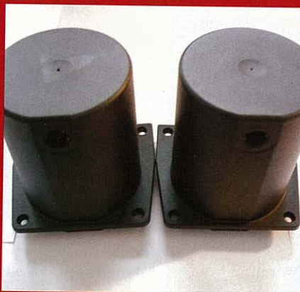
Links ohne, rechts mit Kombi-Steckspitze gespritztes Bauteil: Fließmarkierungen sind nicht zu erkennen.