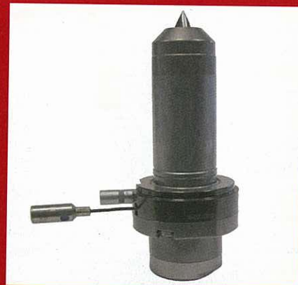
Die neue Kombi-Steckspitze, hier zum Beispiel in einer Düse vom Typ 10SET60S, ermöglicht ein Vermischen der Schmelze in der Art, dass bei Spritzgussteilen keine Fließmarkierungen mehr auftreten.