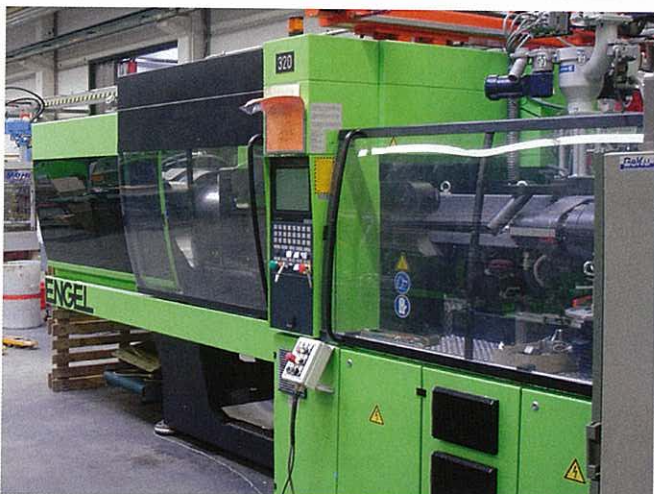
Die Leuchtenabdeckungen produziert der Verarbeiter auf einer Engel-Spritzgießmaschine vom Typ 1050/200 mit 2 000 kN Schließkraft.

Außer dem Fehlen von Fließmarkierungen sind Puppe in der Produktion zwei weitere Qualitätsmerkmale besonders aufgefallen: „Dass bei der Teillelänge der Leuchtenabdeckungen so gut wie kein Verzug und keine Einfallstellen aufgetreten sind, ist schon ein Highlight. Mit konventionellen Düsen hätten wir dies nicht verwirklichen können.“ Nicht zuletzt ermöglicht das Düsenkonzept einen besonders schnellen Farbwechsel, da der Schmelzkanal der Düse sehr strömungsgünstig ohne Verweilstellen ausgeführt ist; ein optimaler Schmelzeverlauf ist die Folge.