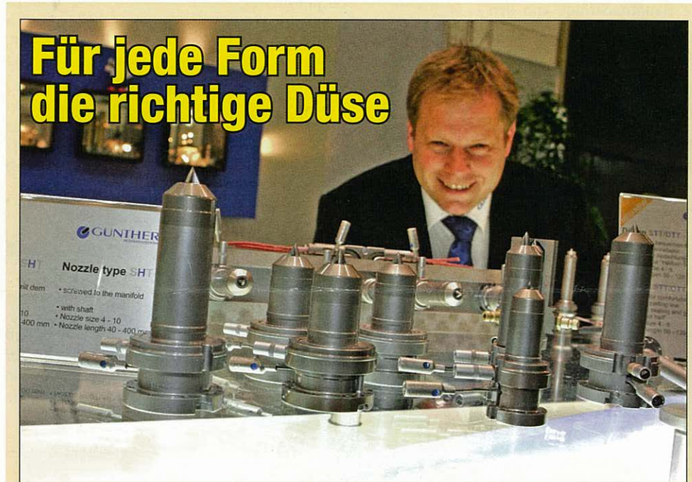
Am 5. Dezember startet die EuroMold 2007 zum 14. Mal. 1.600 Aussteller, über 30 Prozent davon aus dem Ausland, beleuchten die gesamte Prozesskette vom Design bis zum Werkzeug- und Formenbau für die Serienfertigung. Ein zentrales Thema ist der Heißkanal, Trends in Frankfurt sind erweiterte Düsensortimente, wie hier von Günther Heisskanaltechnik, und eine steigende Anzahl von Kavitäten im Werkzeug.

Der Markt für europäische GFK-Produkte wird beherrscht vom Bau- (34,3%) und Transportwesen (33,3%), in weitem Abstand gefolgt von Sport/Freizeit (17,8%) und Elektrotechnik/Elektronik (10,9%). Lediglich 3,7% der GFK-Produkte gehen in andere Segmente. Von der guten Baukonjunktur profitiert vor allem die Elektrotechnik/Elektronik. Aber auch das Bauwesen selbst hat im Vergleich zu den anderen Segmenten leicht zugenommen. Als Fachverband der Hersteller von verstärkten